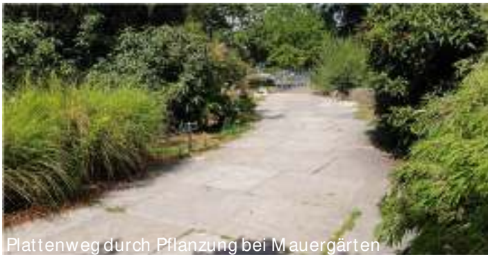
Plattenweg durch Pflanzung bei Mauergärten

Belag: Anbindungen an Hauptweg Asphalt, ansonsten wassergebundene Wegedecke