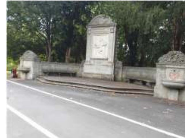
Bestand Schillerdenkmal: gefährliche Wegeführung und unpassende Gestaltung