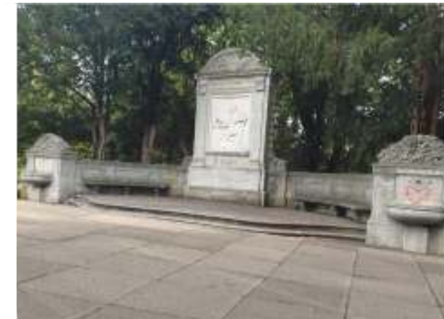
Beispiel Neugestaltung kleiner Platz am Schillerdenkmal