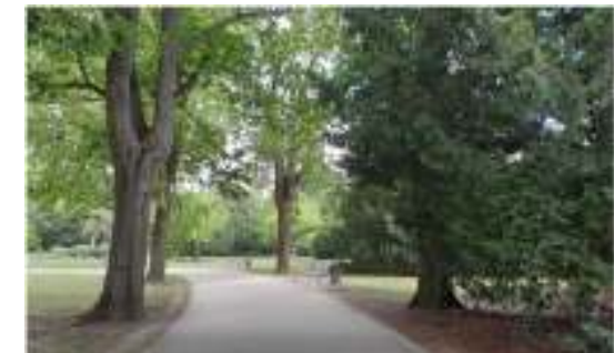
Beispiel: Neue Wegeführung und neuer Belag im Bereich Rosenhügel