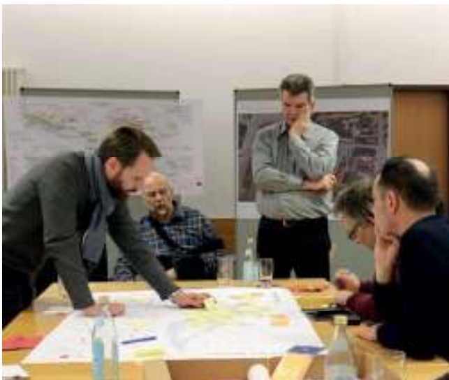
Abb. 48: Kommentar- und Ideensammlung auf Plänen