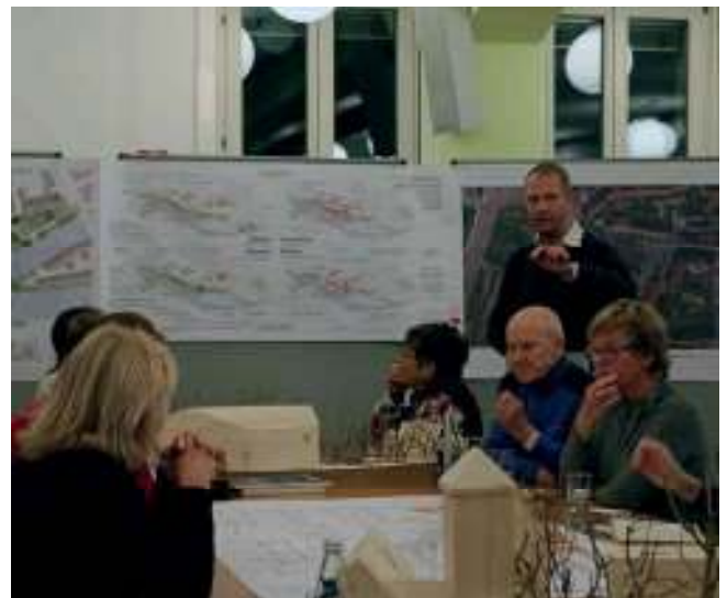
Abb. 49: Gespräche zu den unterschiedlichen Themenschwerpunkten