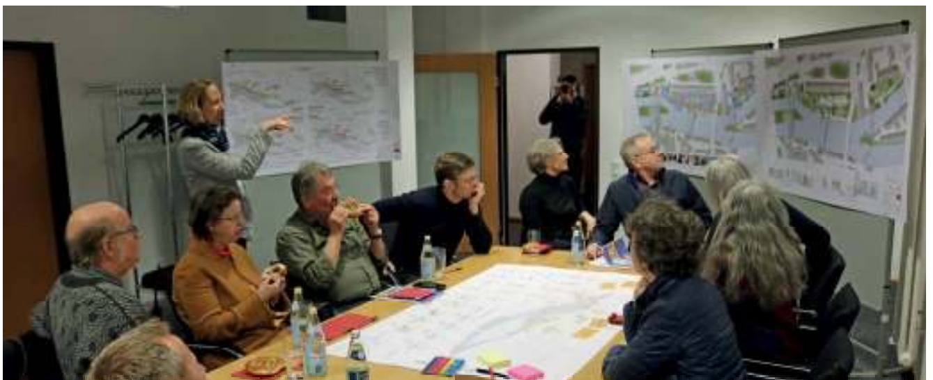
Abb. 47: Intensive Diskussionen in kleinen Gruppen