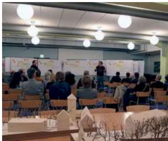
Abb. 51: Bürgerworkshop im Eckstein