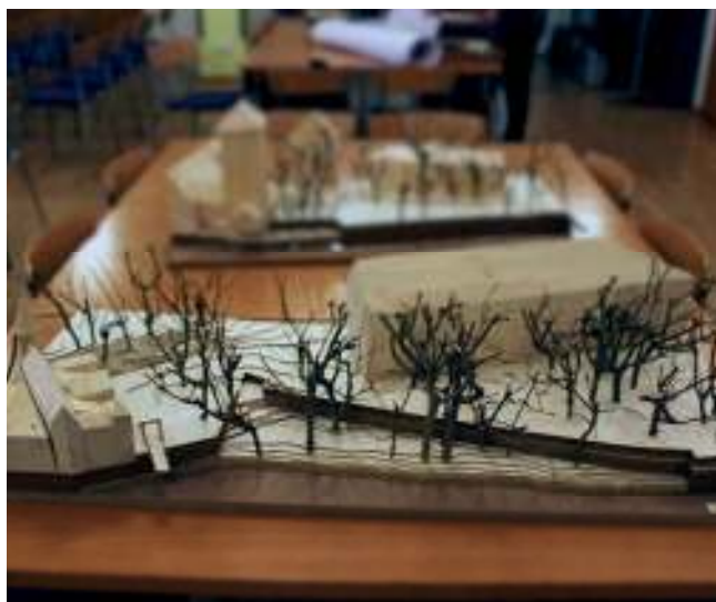
Abb. 50: Arbeitsmodelle zur räumlichen Darstellung