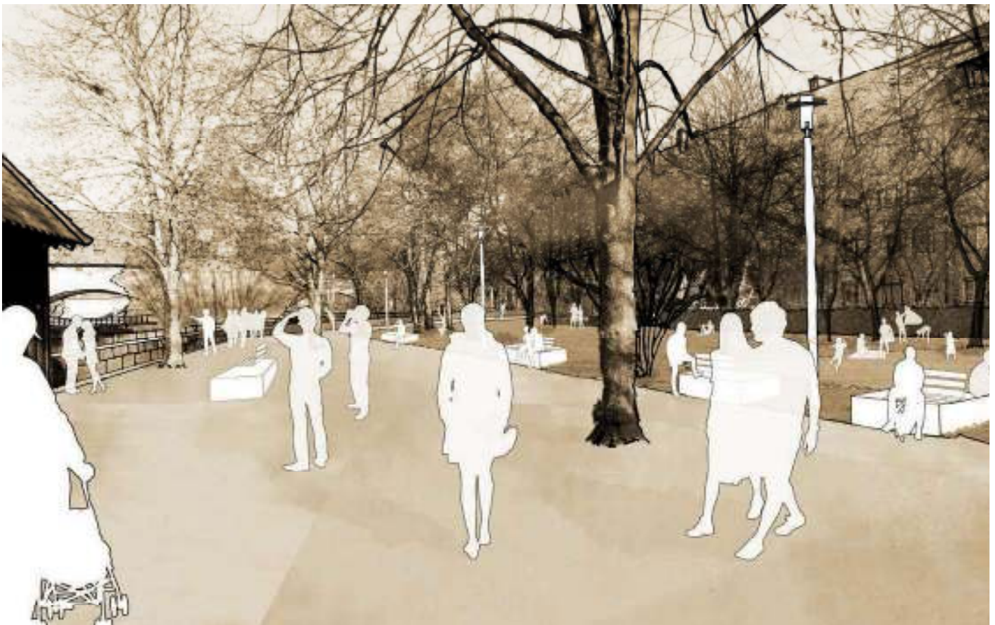
Abb. 64: Uferpromenade an der Pegnitz