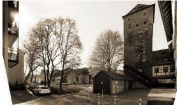
Abb. 62: Aktuelle Situation am Weinstadel

Die neue „Nägeleinspromenade“ schafft eine intuitiv erlebbare Verbindung durch die Freiraumkette an der Pegnitz. Barrierefrei werden die Räume und Flächen neu organisiert. Angesichts der unterschiedlichen Nutzungsansprüche werden die Flächen flexibel gehalten und erlauben eine Multikodierung der verschiedenen Räume. Eine Wegeverbindung um den Weinstadel an der Pegnitz wurde während des Workshops von den Bürgern begrüßt.