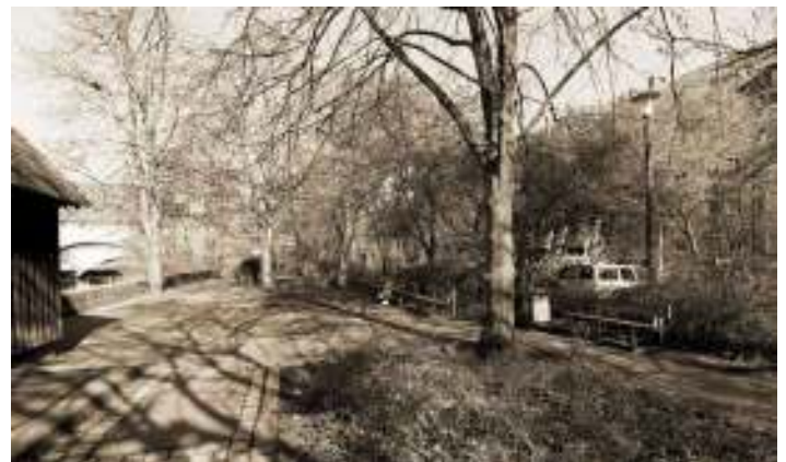
Abb. 63: Aktuelle Situation im Uferbereich neben Parkplatz