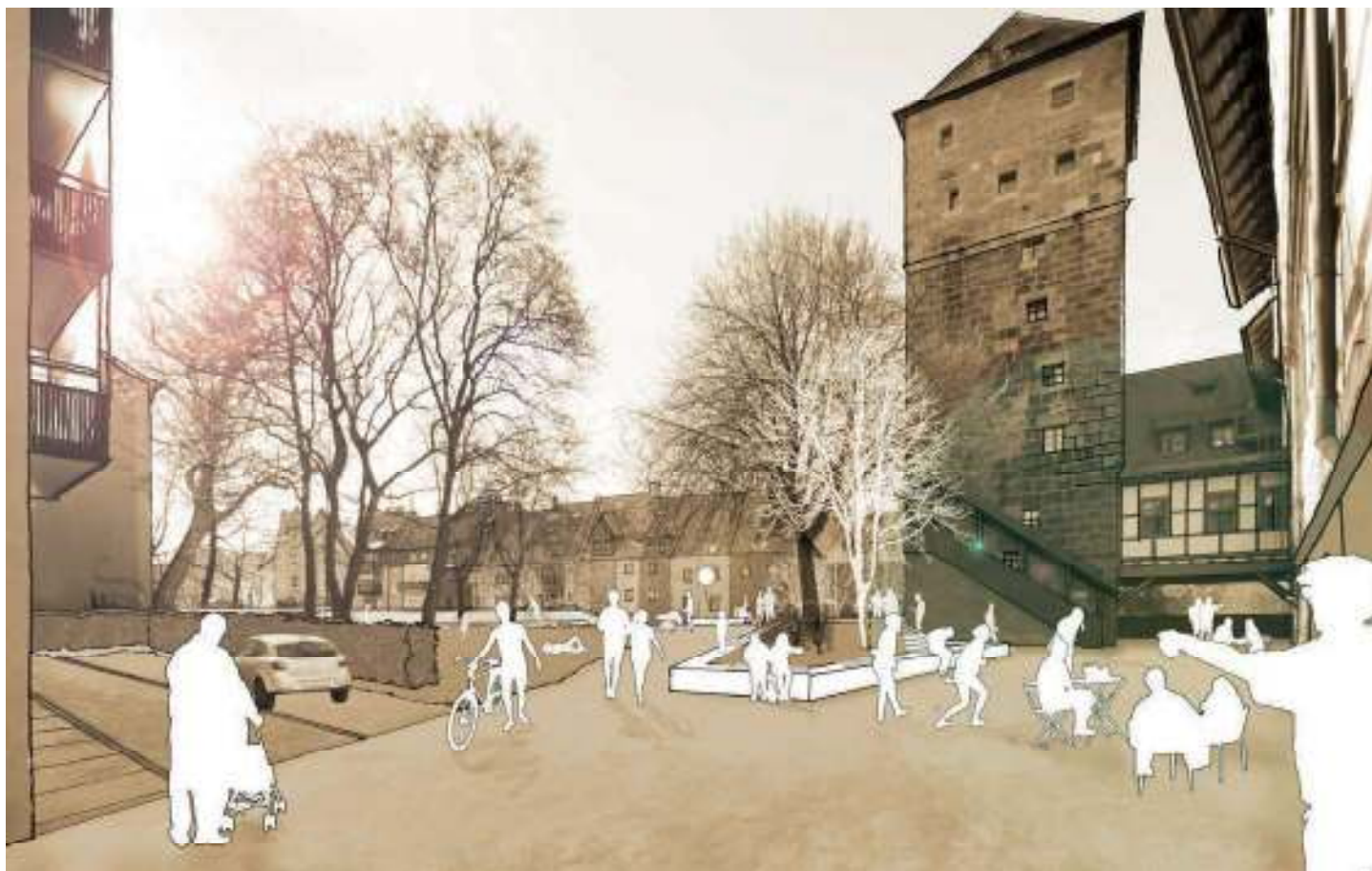
Abb. 61: Entfernen der Garage öffnet Bereich zum Weinstadel