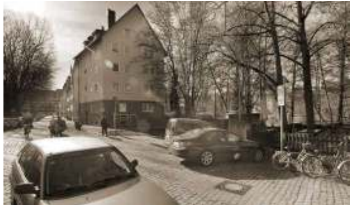
Abb. 71: Aktuelle Situation zwischen Hallertor, Nägeleinsplatz und Maxplatz

Nutzungszugewandte Entwicklungen können den Bereich am Kettensteg und seine Verkehrsströme neu organisieren. Durch den Wegfall von fünf Pkw-Stellplätzen könnten 22 neue Fahrradstellplätze entstehen. Durch eine Änderung der Topographie kann eine barrierefreie Raumverbindung mit durchgängigen Oberflächen geschaffen werden. Im „Hallertorhof“ könnte durch überschaubare Eingriffe eine Aufwertung der Raumsituationen erreicht werden. Hierbei spielen die Neupositionierung des Mobiliars, die Aufwertung des Baumbestandes sowie die Ausrichtung des Strauchbewuchses eine entscheidende Rolle. So kann ein geschützter, ruhiger und hofartiger Charakter entstehen. Der neue Freiraumknoten am Kettensteg wird neuer Orientierungspunkt.