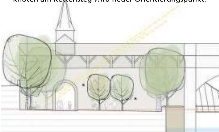
Abb. 72: Schnitt D - Der „Hallertorhof“