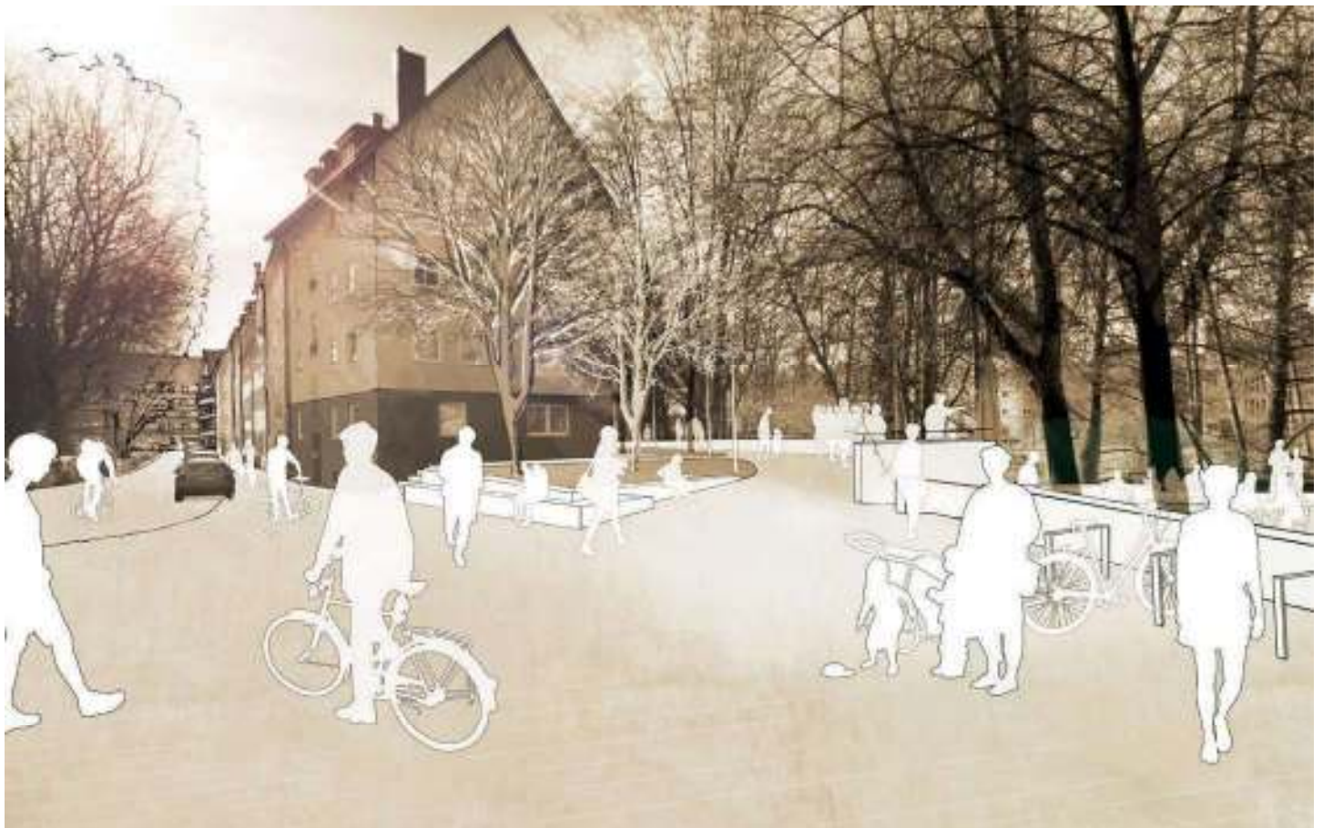
Abb. 70: Barrierefreier Übergang zwischen Nägeleinsplatz und Hallertor