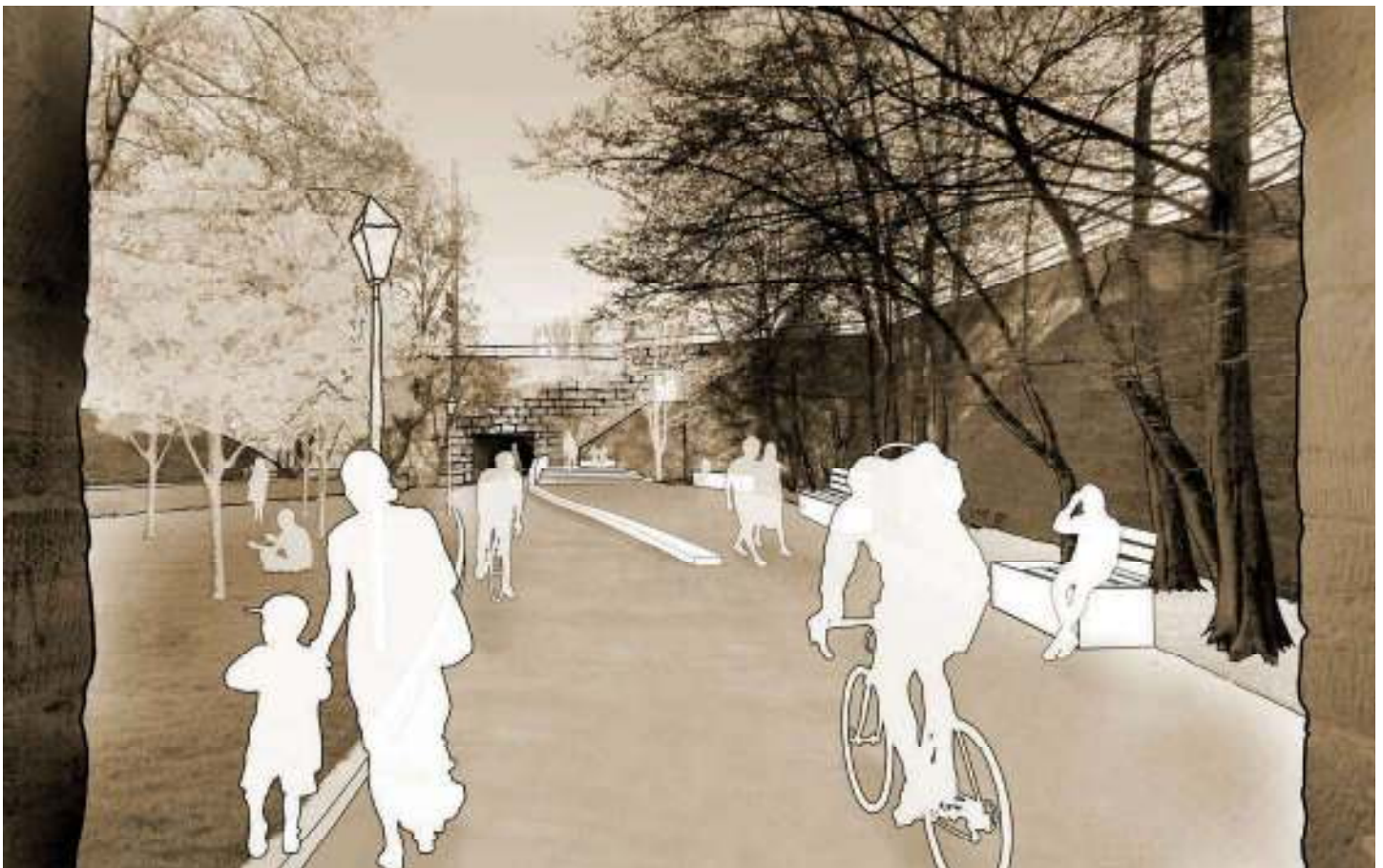
Abb. 74: „Hallertorhof“ mit Aufenthaltsmöglichkeiten