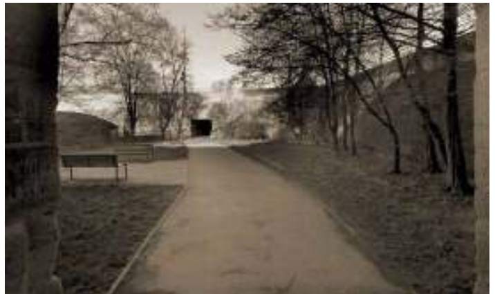
Abb. 73: Aktuelle Situation am Hallertor