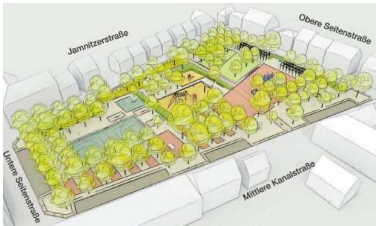
Der Entwurf für den neuen Jannitzerplatz sieht eine Dreiteilung der Fläche mit einer Wiese, dem Kinderspielplatz in der Mitte und dem Streetball-Feld für Jugendliche vor; auf der Ostseite zieht sich vom Brunnenfeld eine „Aktionsfläche“ mit vielen neuen Sitzgelegenheiten entlang. Bäume und Grün spielen eine wichtige Rolle. F.: Hackl Hofmann Landschaftsarchitekten/Sör

Ein wichtiges Anliegen ist der Planerin das Grün am Platz. Von den bisher 108 Bäumen sollen bis auf zwei alle erhalten sowie elf neue gepflanzt werden. Zudem sind bunte Blumenwiesen angedacht, auf besonderen Wunsch von Kindern und Jugendlichen will man auch Bäume mit essbaren Früch-