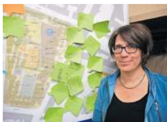
Von Landschaftsarchitektin Stephanie Hackl stammt der Entwurf für den neuen Jannitzerplatz.

Ideen, die bis zum 14. April auch wieder via Internet über www.onlinebeteiligung.nuernberg.de abgegeben können, ausgewertet und in den Entwurf eingearbeitet. Im April soll noch